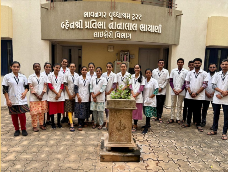
મેડીકલ કોલેજના વિદ્યાર્થીઓની મુલાકાત