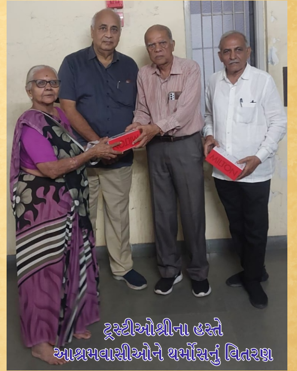
ટ્રસ્ટીઓશ્રીના હસ્તે આશ્રમવાસીઓને થર્મોસનું વિતરણ