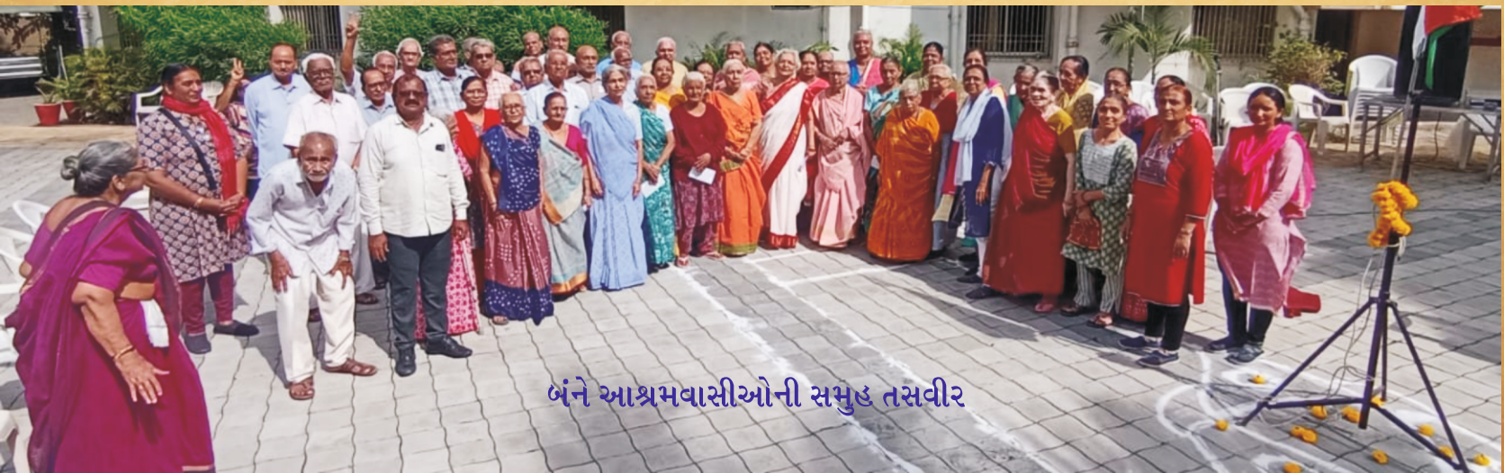
બંને આશ્રમવાસીઓની સમુહ તસવીર