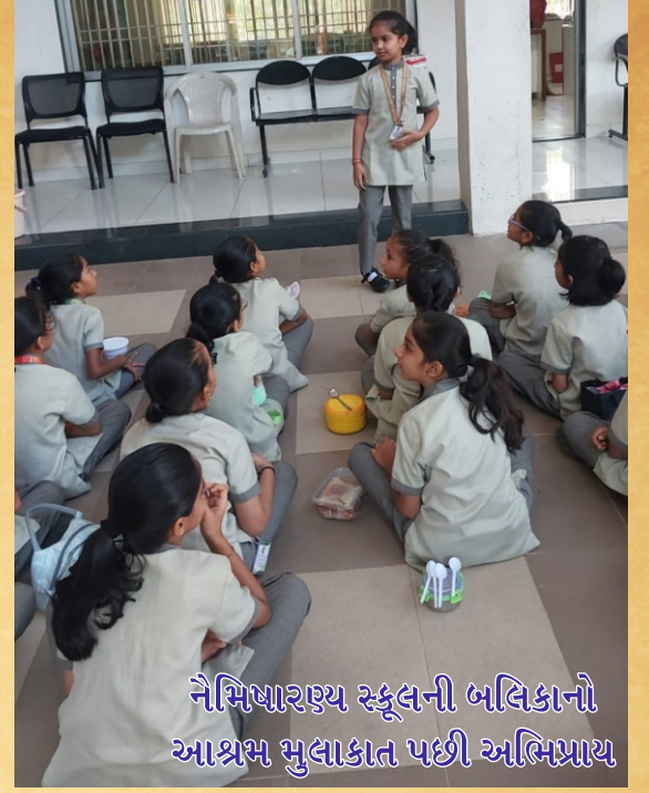
નૈમિષારણ્ય સ્કૂલની બલિકાનો આશ્રમ મુલાકાત પછી અભિપ્રાય