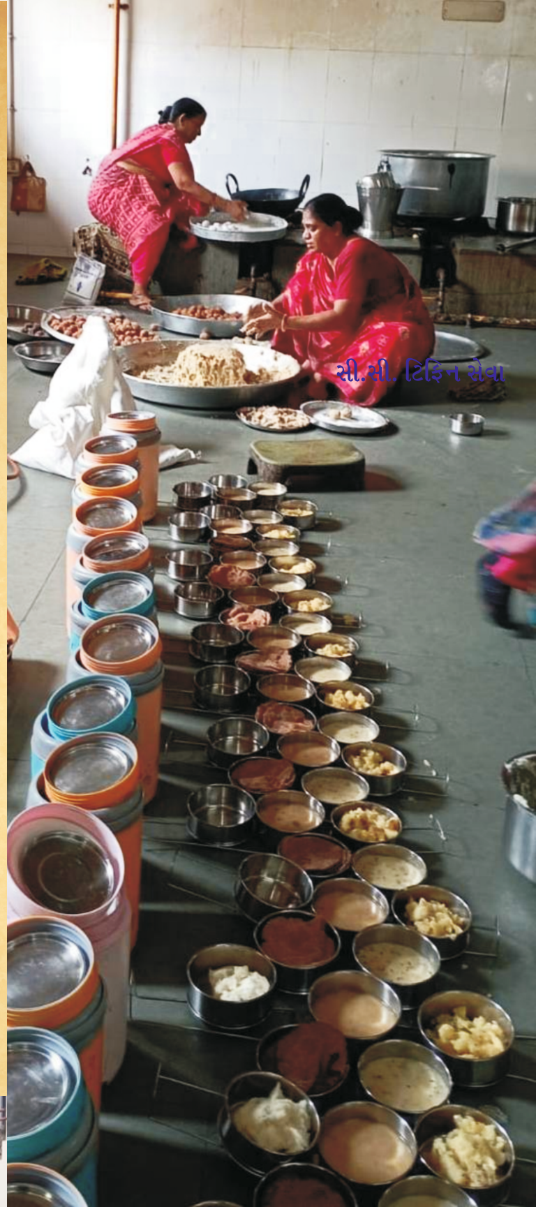
શ્રી.સી. ટ્રેડિંગ સેવા