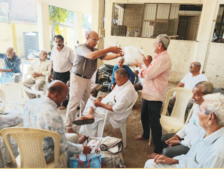
મહેન્દ્ર પ્લાસ્ટીકવાળા તરફતી કપડા વિતરણ