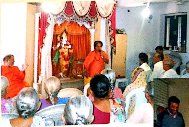
પ્રાર્થના ખંડ અને મંદિર